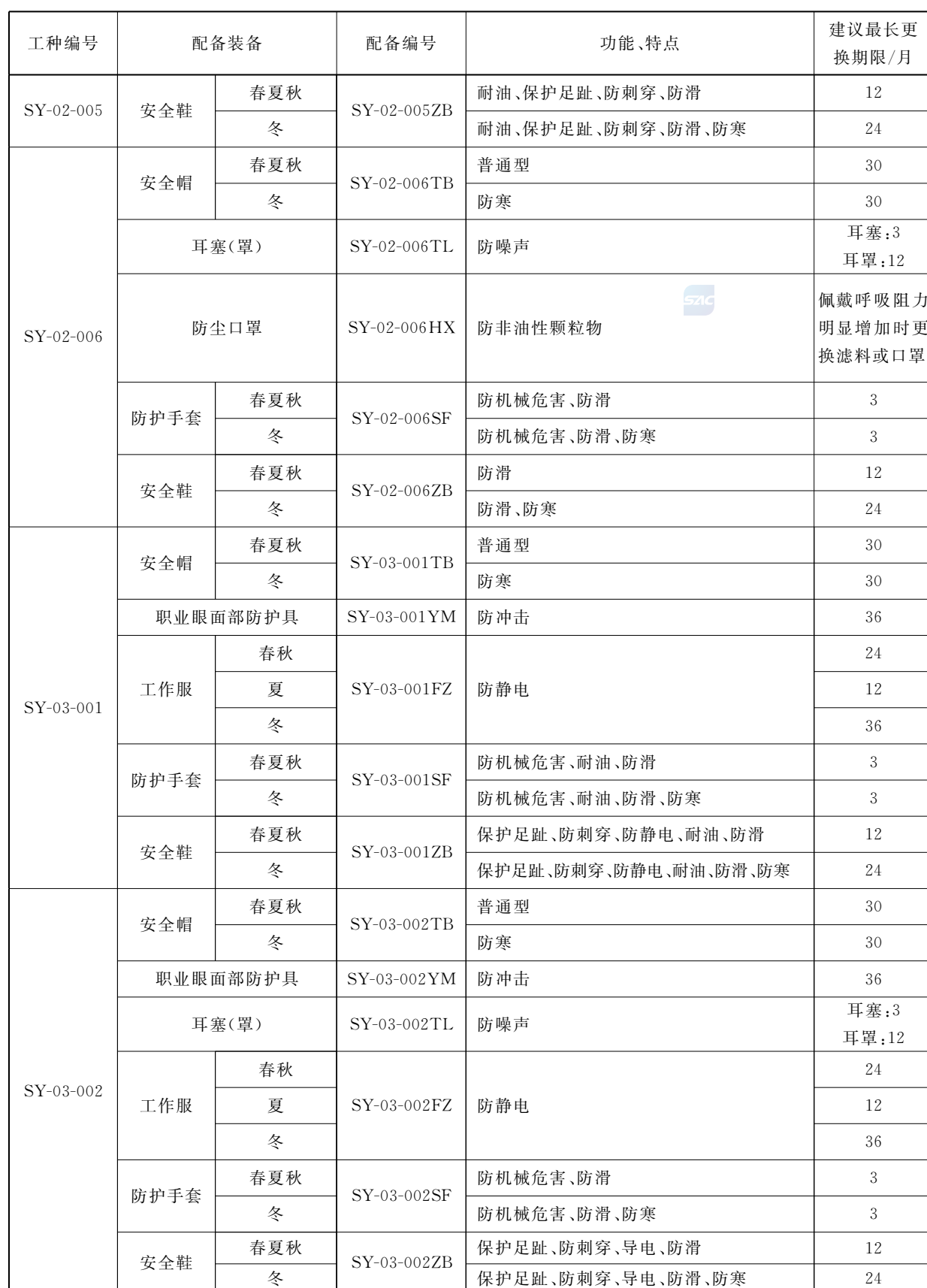
表 B.1 (续)